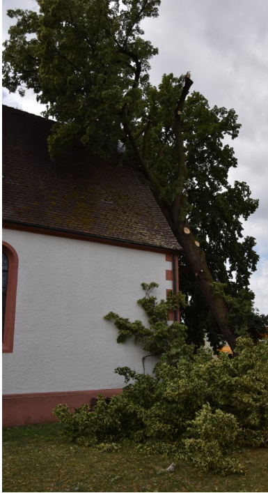
So sah es nach dem Sturm aus. Die Linde lehnt sich an die Kirche an. Ein Schaden entsteht