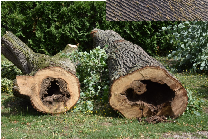
an der Spitze des Daches. Am Mittwoch 12.07.23 wird die Linde gefällt und neben der Kirche abgelegt.

Jeder kann sowohl ihren Zustand als auch den Schaden an der Kirche ansehen.